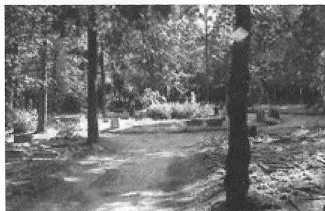
De begraafplaats in Staverden

Een begrafenis duurde meestal erg lang. De rouwdienst thuis, naar Elspeet lopen, de dienst op het kerkhof, terug lopen vanaf Elspeet en de nabegravenis namen veel tijd in beslag.