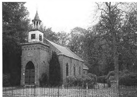
Nederlands Hervormd kerkje in Staverden

Was de kerk vol, dan moest men vragen of men bij ons in de bank mocht zitten. Meestal voorkwam mijn moeder dat vragen en nam al bij het binnenkomen in de kerk een paar mensen mee die dan bij ons in de bank konden zitten.