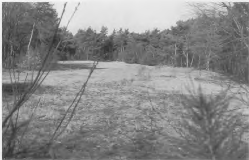
De voormalige schietbaan na afbraak van de poorten