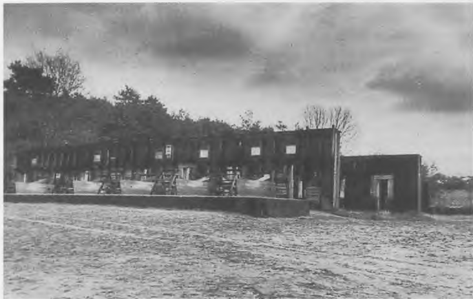
De 200 meter poortschietbaan

en buiten de Rijksgrenzen gestationeerd 4) . Behalve het opleiden van personeel kregen deze eenheden als nevenopdracht beveiligings- en bezettingstaken te vervullen. In Harderwijk leidde het besluit tot de komst van het 'Ile Ersatz- und Ausbildungsbataillon Hermann Göring' ('II./E.u.A.Btl. H.G') dat o.a. op de W.G.F. Kazerne onderdak vond. Op de Oranje Nassaukazerne werd de 'Artillerie und Flak Kompanie' van de Kriegsmarine gestationeerd. Marinepersoneel kreeg in deze compagnie een opleiding voor luchtverdedigingstaken aan boord van schepen of aan de wal. Hoewel het in Amsterdam gestationeerde 'Luftgaukommando' in Ermelo en Harderwijk de grootste gebruiker was van de militaire ac-