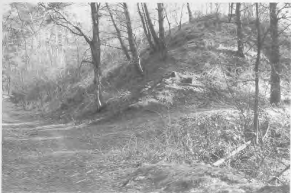
De achterzijde van de kogelvanger in 1999

De commandant van het SS 'Pionier Bataillon', Sturmabführer'